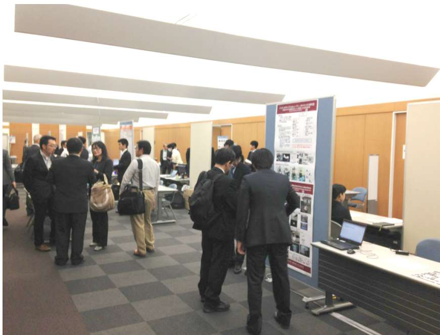
※2015年秋季大会 産学ポスターセッションの様子 (北九州市 西日本総合展示場にて開催)