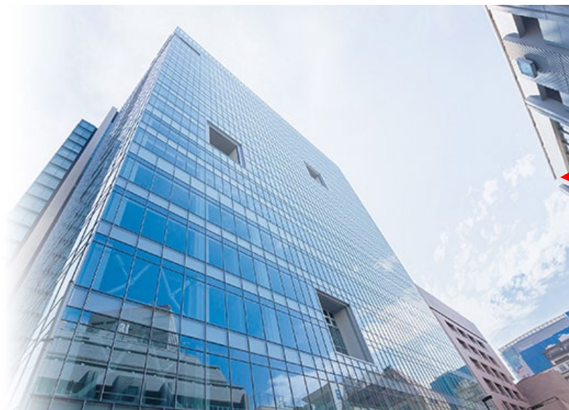
タワースコラ 1階 S101教室